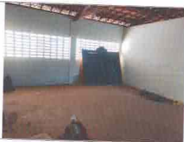
Descrição: Salas para a realização dos atendimentos