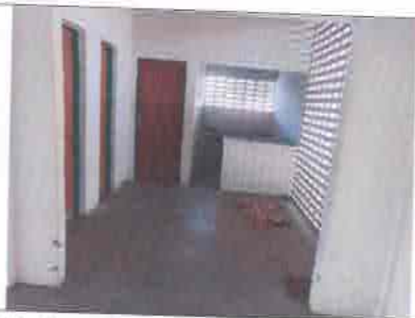
Descrição: Espaço de uso coletivo (cozinha e banheiros)