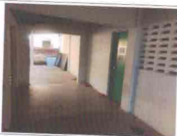
Descrição: Corredor que dá acesso às salas