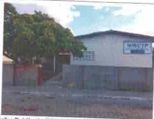
Descrição: Prédio da Oficina Escola/SETHAS/RN